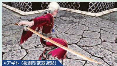
*アギト(抜剣型武器迷彩)