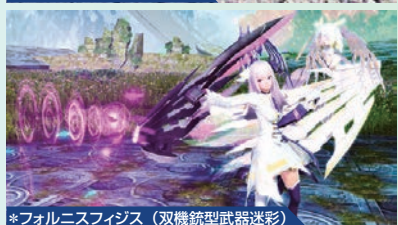
*フォルニスフィジス(双機銃型武器迷彩)