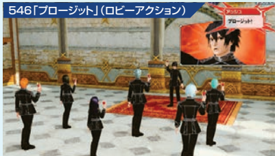
546「プロージット」(ロビーアクション)