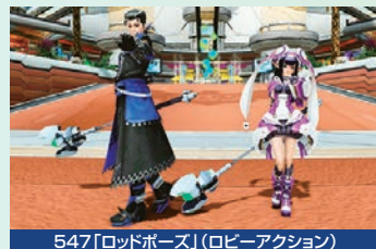
547「ロッドポーズ」(ロビーアクション)