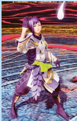
ハナドキ インユウ [Ou][Ba]