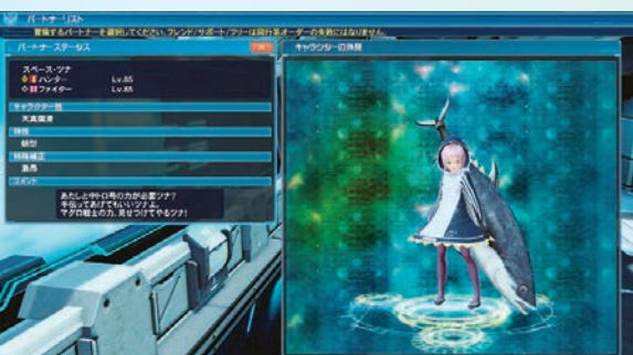
▲パートナーカードは5人全員手に入れることが可能。ちなみに、スペース・ツナの言っている中トロ号とは、彼女が持っている武器の名前だ。

2018年に開催された「ウェポノイドコスチューム総選挙」で上位に入賞したウェポノイドたちが、公約のコスチューム配信に先駆けて『PSO2』に参戦。期間限定クライアントオーダーでは、パートナーカードや交換アイテム「虹色のリボン2019」などが入手可能。また、ウェポノイドはEトライアルでも登場し、クリア報酬で武器迷彩をくれることも。