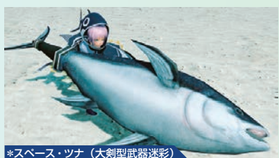
*スペース・ツナ(大剣型武器迷彩)