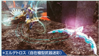
*エルデロス(自在槍型武器迷彩)