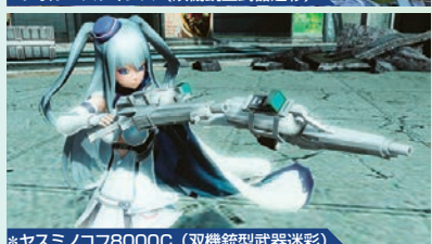
*ヤスミノコフ8000C(双機銃型武器迷彩)