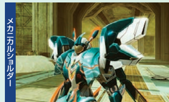
メカニカルシヨルター