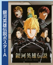
銀河英雄伝説ポスターA

人気作「銀河英雄伝説 Die Neue These」コラボが実現。ラインハルトとヤンの軍服やヘアスタイルが配信される。軍服には女性用もあるので男性キャラがいらない人も安心。そのほか、陰陽師イメージのレイヤリングウェアも。