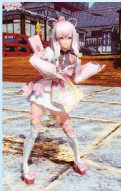
ハナドキ カフウ [Ou][Ba]