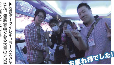
▲池袋ダークイレギュラーズのみなさん。優勝賞品である大量のニンニクを持って帰る。