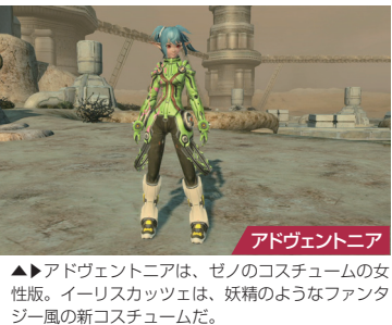
アドヴェントニア

▲アドヴェントニアは、ゼノのコスチュームの女性版。イリスカッツェは、妖精のようなファンタジー風の新コスチュームだ。