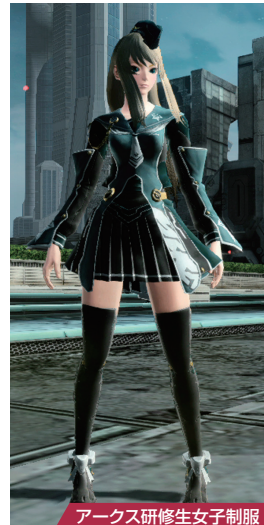
アークス研修生女子制服

▲アークス研修生向けの制服で、公的な催事などで着用される。写真は女性用だが、これとは別に男性用も存在。