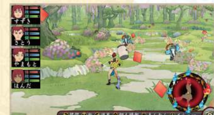
▲「熱狂の赤い火」中は、珍しいものを手に入るチャンス! 火時計に赤い火が混じってれば、テンションが上がります。

強い武器は迷宮の奥にあるだろう。そんな思い込みのもと、討伐に出かけたら数カ月は迷宮に潜り続けます。何か月も潜っているとキャラの健康度が下がることがあり、健康度の低くなったキャラから、「早く帰還してくれ!」と訴えられている気もしますが、聞こえないことにして討伐を続行しています。すべては次世代のためなんです!